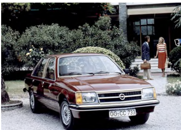
Opel Commodore C