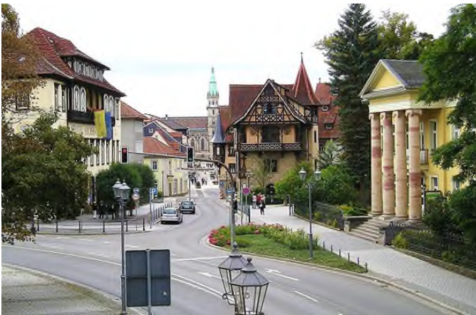
Meiningen, Blick zur Georgstraße