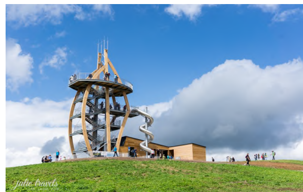
Ellenbogen, Noahs Segel