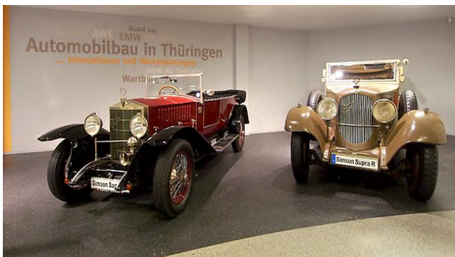
Fahrzeugmuseum: Simson Supra Automobile