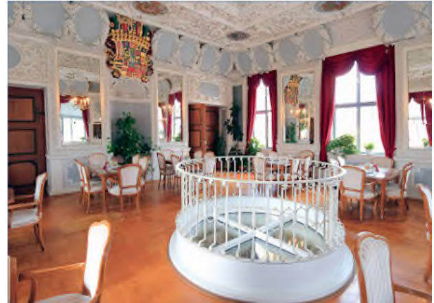
Turmcafé im Schloss Elisabethenburg