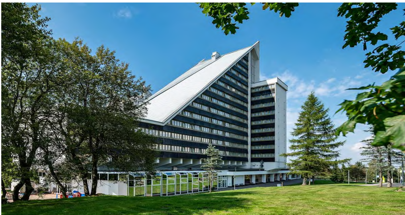
AHORN Panorama Hotel Oberhof