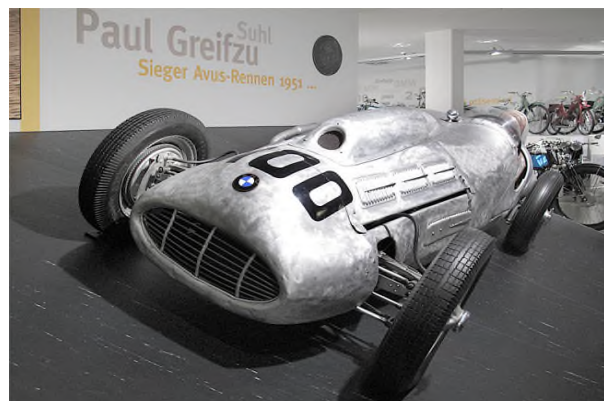
Fahrzeugmuseum: Greifzu BMW-Sieger beim AVUS-Rennen Berlin 1951