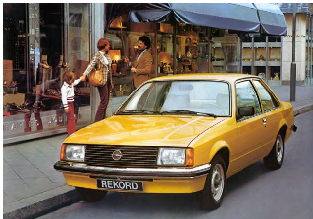
Opel Rekord E1

Freitag den 12. bis Sonntag den 14. Juni 2020